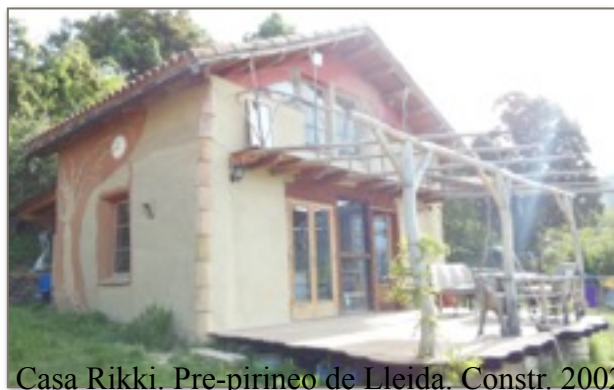
Casa Rikki. Pre-pirineo de Lleida. Constr. 2002