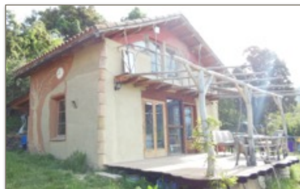
Casa Rikki. Pre-pirineo de Lleida. Constr. 2002